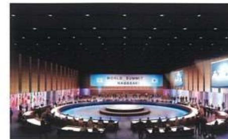
コンベンションホール(約2,700㎡)