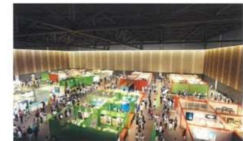
イベント・展示ホール(約3,800㎡)