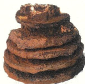
イセエビリーフ藻礁