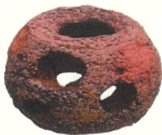
リーフボール藻礁