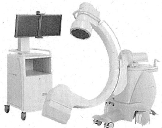
②外科用X線テレビシステム(イメージ)