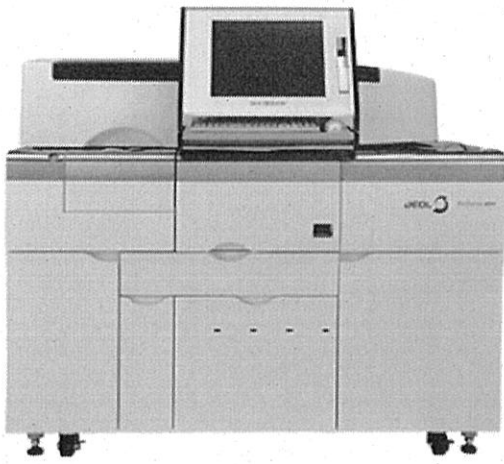
①自動分析装置(イメージ)