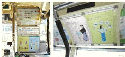
↓ 車内へのポスター掲出