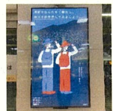
↑ 電子看板での放映