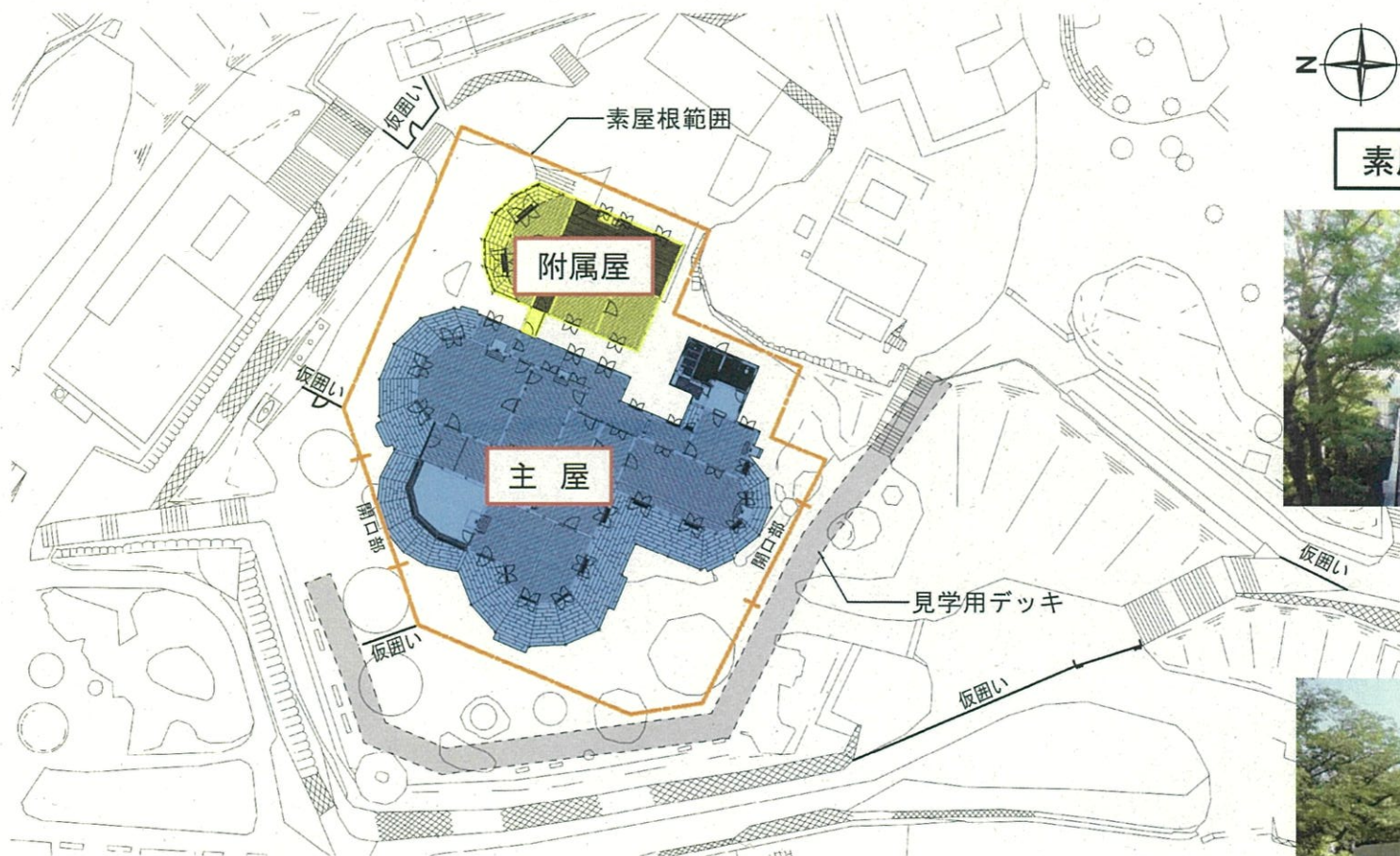
素屋根設置状況写真