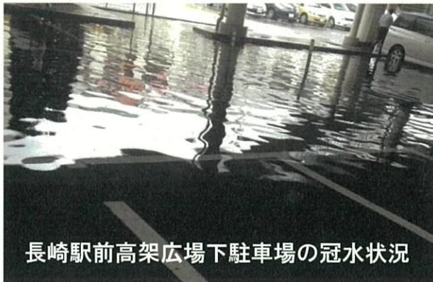
長崎駅前高架広場下駐車場の冠水状況