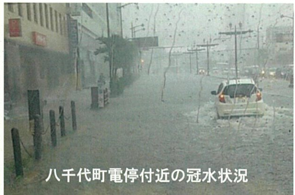
八千代町電停付近の冠水状況