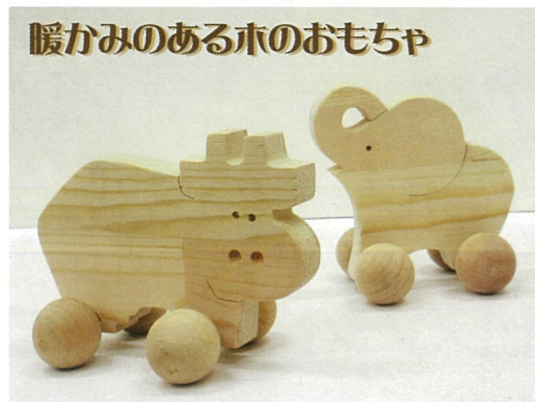
暖かみのある木のおもちゃ