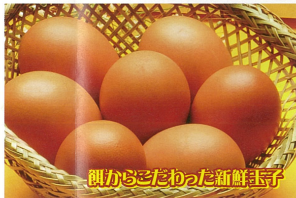
餌からこだわった新鮮玉子