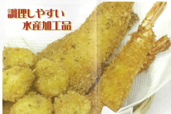
調理しやすい 水産加工品