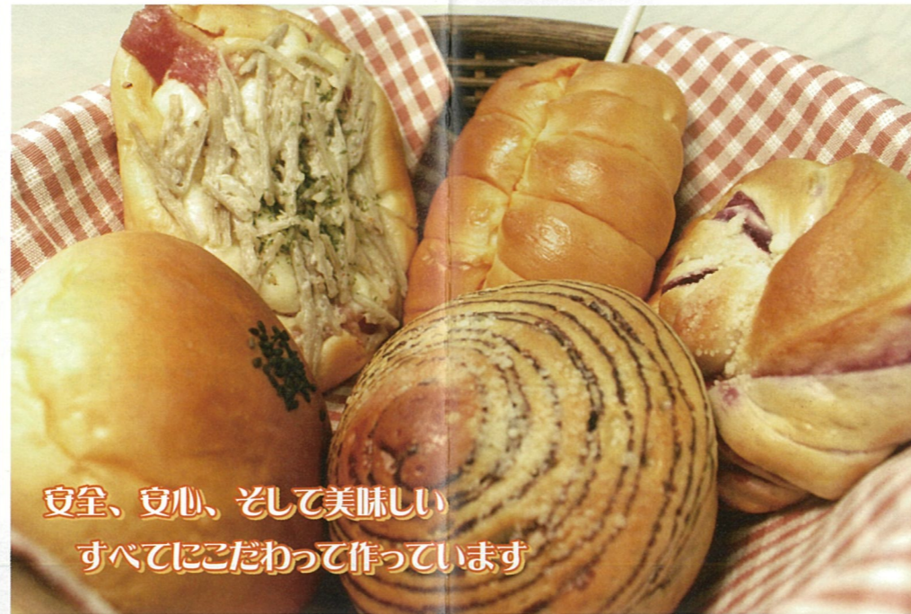
安全、安心、そして美味しい すべてにこだわって作っています