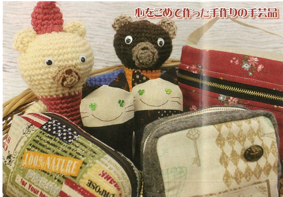
心をこめて作った手作りの手芸品

さんらいす 〒852-8102 長崎市坂本 1-1-46 TEL 095-843-6274 FAX 095-893-6477