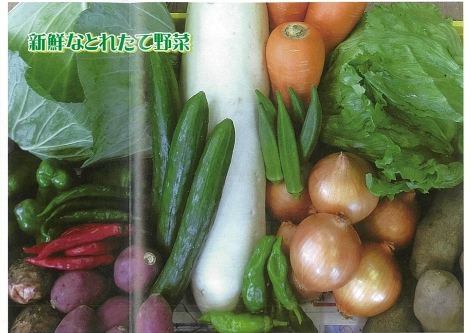
新鮮なとれたて野菜