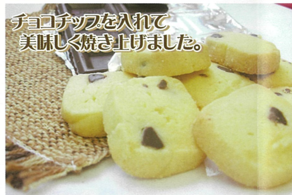
チョコチップを入れて 美味しく焼き上げました。