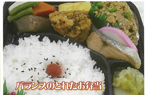
バランスのとれたお弁当

つくもの里 〒851-3101 長崎市西海町 2348-12 TEL 095-884-3026 FAX 095-884-3138