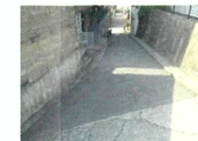
回遊路整備(丸山町周辺)