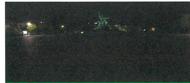
平和公園整備イメージ