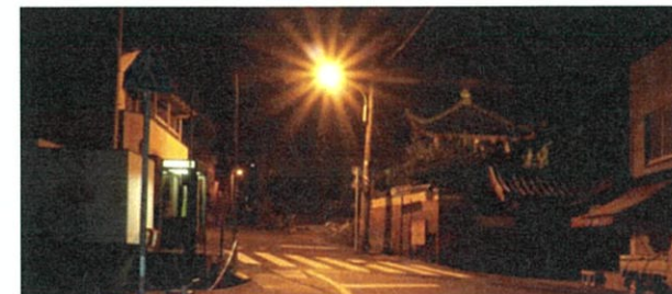
唐人屋敷跡整備イメージ