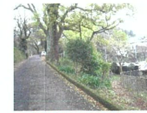
南山手地区環境整備