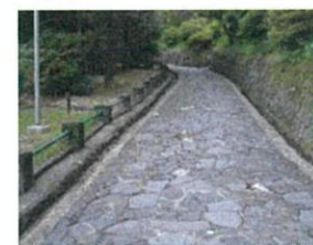
平和公園の園路整備

2020年の「被爆75周年」に向け、平和公園・天主公園と回遊路の景観整備等を行う。