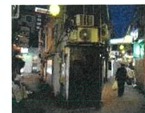
銅座地区路地整備