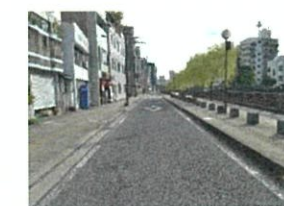
回遊路整備(中島川寺町界隈)