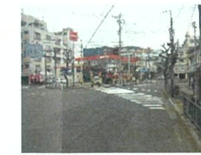
平和公園周辺道路の整備(市道松山町大橋町線)