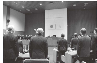
⑦議場閉場式での国旗・市旗降納の様子