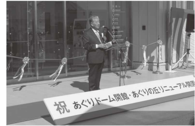
⑥あぐりドーム開館・あぐりの丘リニューアル開園式典