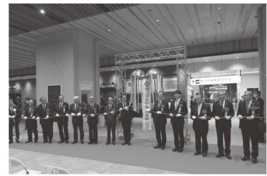
⑤西九州新幹線長崎駅開業記念式典