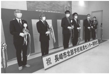
① 北部学校給食センター開所式