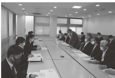
④ 原子爆弾被爆者援護対策に係る厚生労働省への要望活動