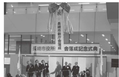
⑧長崎市役所新庁舎落成記念式典