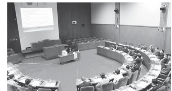
▲議場での議員研修会の様子

3月22日に、「持続可能な開発目標（SDGs）を目指した健全な地域づくりと観光地としての在り方」をテーマに、議員研修を実施しました。内閣府のクールジャパン・地域プロデューサーを講師としてお招きし、訪問客のニーズに対応しつつ、現在の経済、社会、環境への影響を十分に考慮した観光地としての在り方などについて多くの議員が学びました。