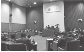
▲全員協議会で市長が説明

3月6日、長崎市における新型コロナウイルス感染症対策について、全員協議会を開催しました。開催に当たり、議会から、感染の可能性がある市民への対応、予防対策、子どもの預かり場の確保、学校給食中止に伴う外部委託業者の損失に対する支援、放課後児童クラブの体制の整備などの質問があり、市長から、質問の回答と合わせて、相談窓口や市立小・中学校及び高等学校への対応、放課後児童クラブや保育園、認定こども園、幼稚園、子育てセンターの利用、市主催のイベントの開催等について報告、説明を受けました。