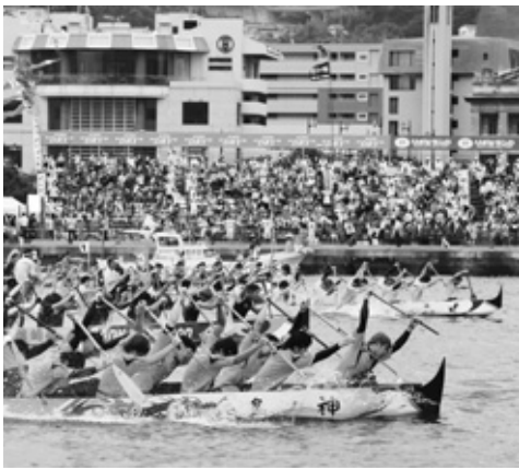
長崎ペーロン選手権大会

答 相生市の記念大会に、職域の部の代表チームを派遣することは、同市へのペーロン伝来を思い起こす意味でも、非常に有意義であると思われるので、ぜひ派遣したいと考えている。今後とも、ペーロンを通じた人的交流はもとより、様々な分野での相互交流をさらに進めたい。