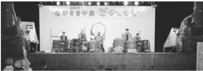
ながさき半島“五活祭(ごかつさい)”の様子

答 合併地区の個性を活かしたまちづくりや、地域振興を図ることは大変重要である。合併地区における祭りやイベントへの支援を行っているが、多くの皆様の参加をいただき、コミュニティ活動の中心的な役割を果たすとともに、まちづくりの新しい取り組みを住民同士で考えるきっかけになっていく。交流人口の拡大を目指したイベントについても、地区内外から多くの方々に参加していただいております。今後とも地域の特性を活かし、合併地区の地域振興に資するよう積極的に取り組みたい。