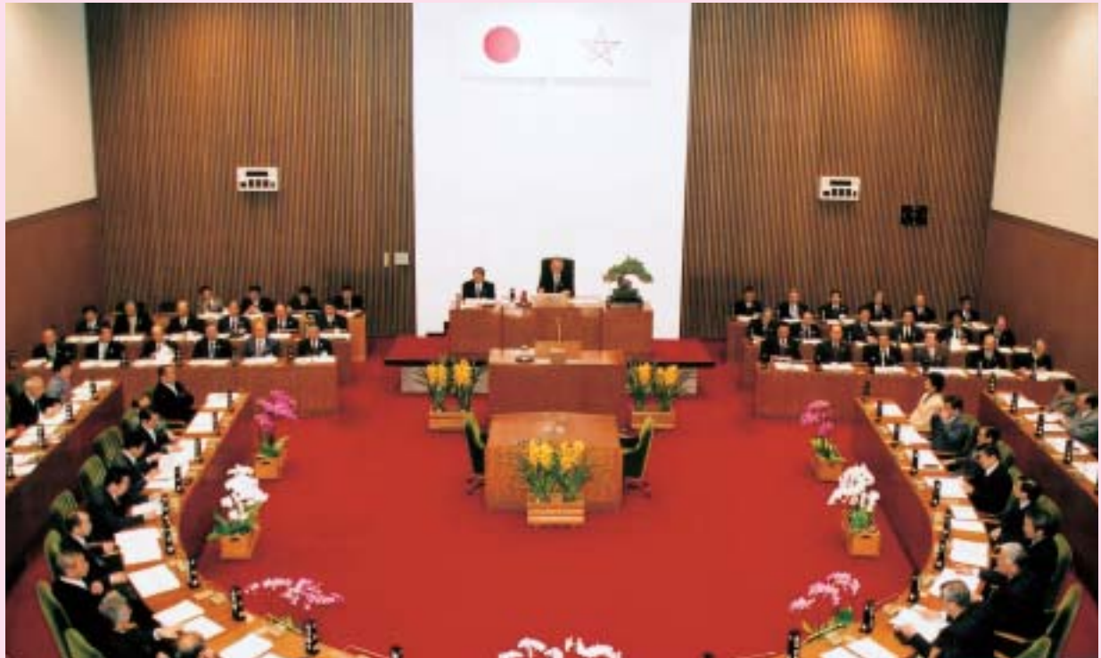
平成18年2月臨時会(2月10日)