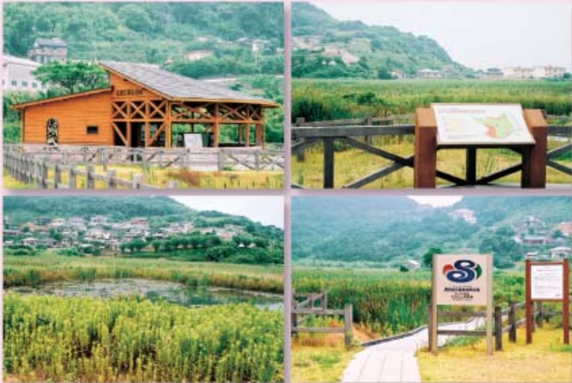
黒崎永田湿地自然公園（外海地区）