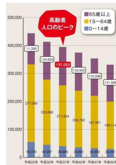
長崎市の要支援・要介護認定者数(人)