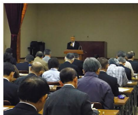
公開講座の講師を勤めました