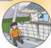
棚や自動販売機には近づかない