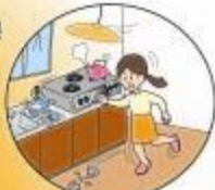
火の始末はあわてずに！