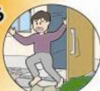
あわてて飛びださない