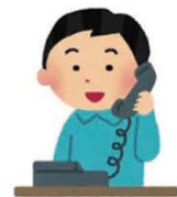
テレフォンガイダンス