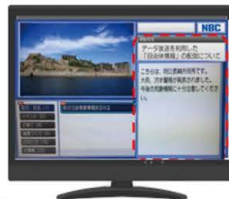
テレビのデータ放送