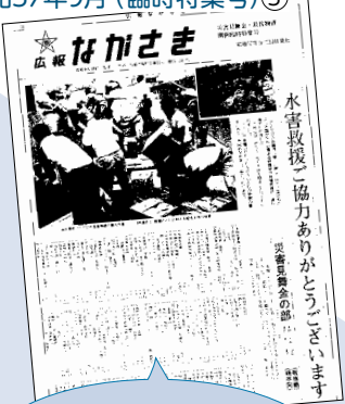
昭和57年9月(臨時特集号)⑤