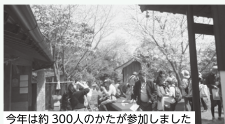
今年は約300人のかたが参加しました

貴重な灯台の内部に興味を惹かれ る子どもたち や楽しくお しゃべりをし ながら桜を楽 しむ家族の 姿、また地元 住民と郷土料 理や町並みを テーマに会話 を楽しむ参加 者でにぎわい ました。