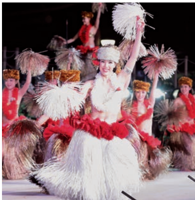
スパリゾートハワイアンズフラガール

いわき市は、福島県の東南端にあり、太平洋に面し、寒暖の差が比較的少なく温暖な気候に恵まれたまちです。いわき湯本温泉の豊富な温泉を利用した大型レジャー施設「スパリゾートハワイアンズ」など、多彩な観光資源があります。今年、市制施行50周年の節目の年にあたることから、力強い復興と創生に取り組み、「明るく元気ないわき市」の創造を目指しています。