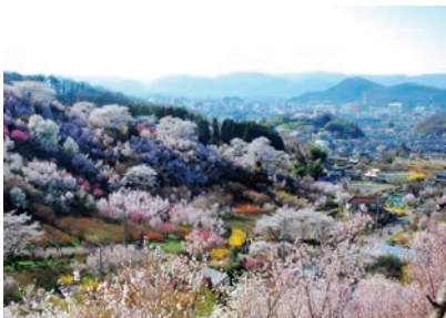
花の名所 花見山公園から見た風景