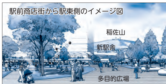
駅前商店街から駅東側のイメージ図