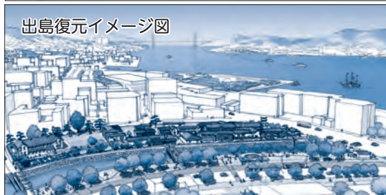
出島復元イメージ図