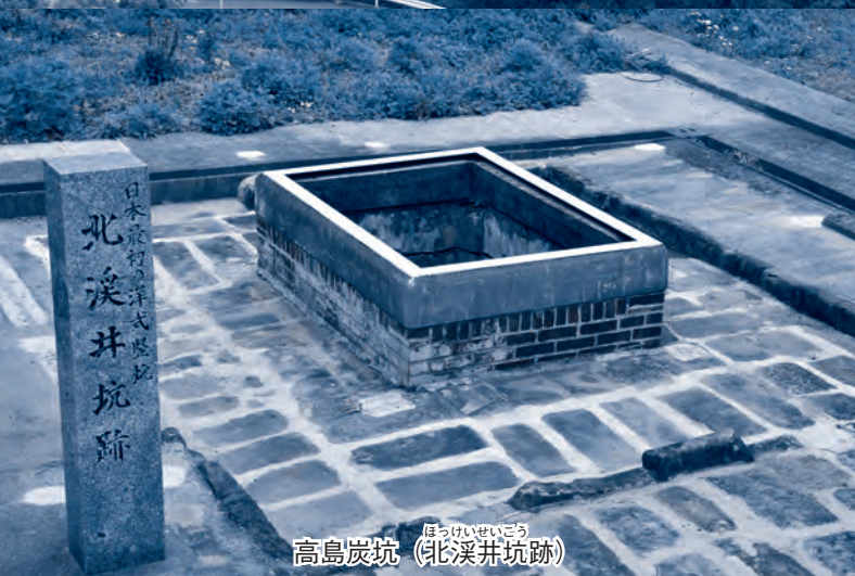
高島炭坑 (北溪井坑跡)