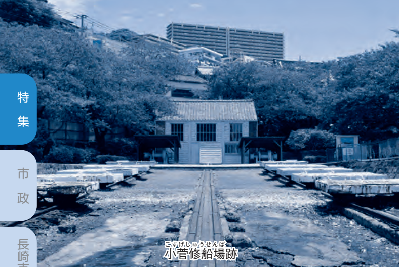
長崎市の歴史 小菅修船場跡