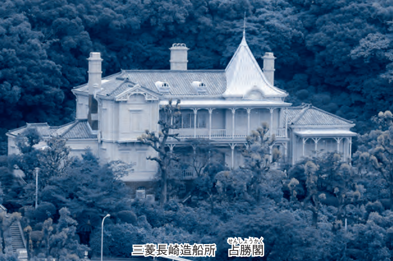
三菱長崎造船所 吉勝閣