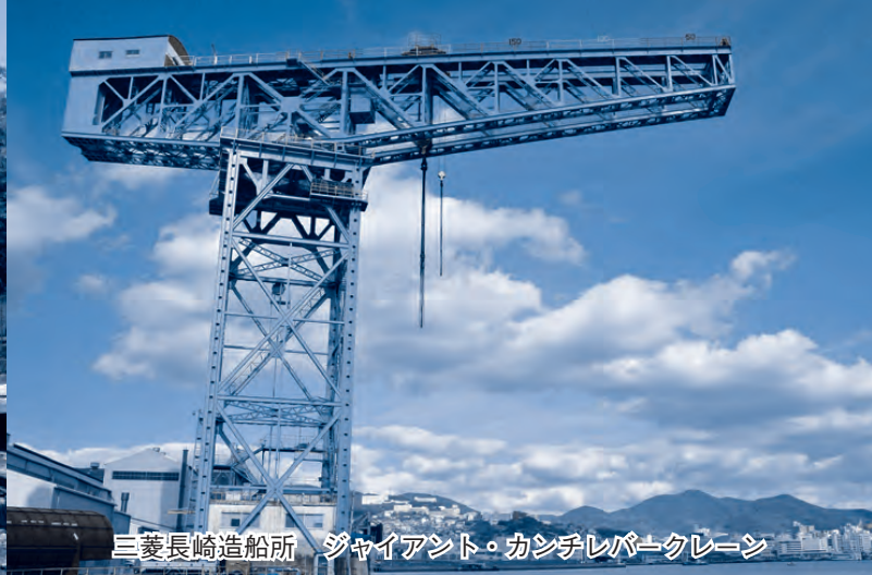
三菱長崎造船所 ジャイアント・カンチレバークレーン