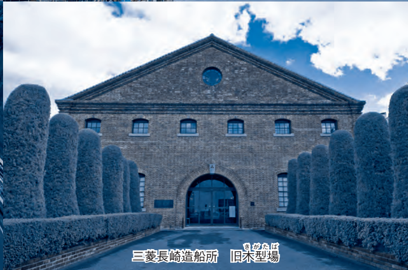
三菱長崎造船所 旧木型場