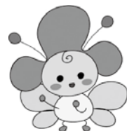
マスコットキャラクター ランタナちゃん