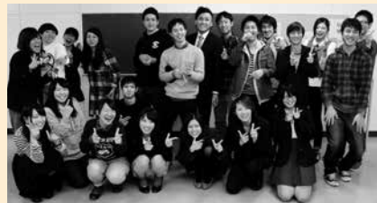
よりよい成人式を目指して 新成人の皆さんも活動しています!!

日 1月11日(日)午後2時～2時30分(午後1時15分開場) ※午後1時50分以降は入場不可 所 公会堂