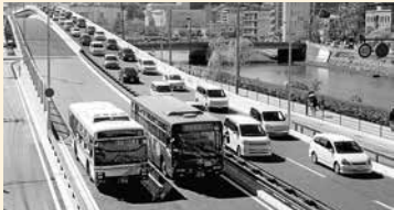
乗員をバス1台30人、乗用車1台1.5人とすると、バス2台で乗用車40台分

一人ひとりの何気ない取り組みで、地球温暖化を防ぐことができます。これからの季節は、暖かい衣類を着て、暖房温度を下げる「ウォーム・ビズ」に取り組みましょう！