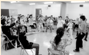
介護施設ボランティア養成講座

このうち、高齢者ふれあいサロンの運営ボランティアや介護施設で入所者の話し相手をするボランティアなどでは、活動に応じてお買い物券や現金に交換できるポイントを提供する「ボランティアポイント制度」を取り入れています。