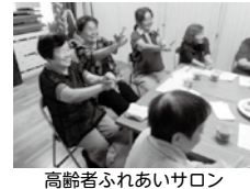
高齢者ふれあいサロン