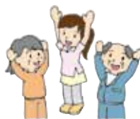
介護予防 ボランティア

高齢者ふれあいサロンサポーター、介護施設ボランティア、在宅ボランティアなどもあります。