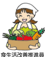
食生活改善推進員