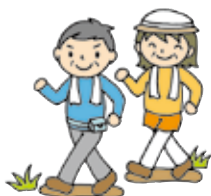
ロードウォーク サポーター