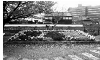
昨年度最優秀デザインの植栽の様子

対市内の小学3~6年生 内出島対岸の「中島川花壇」のデザイン テ(部)門 ①春咲きの花を使ったもの ②パンジーを使ったもの 申小学校で配布の応募用紙に書いて、長崎市みどりの課(〒850-8685 桜町2-22)へ郵送ください。市ホームページにある応募用紙でも応募可。各部門1人1点まで。申(期限)9月30日(火)消印有効 他入賞者は平成27年1月8日(木)に表彰。1月下旬に植栽します。