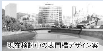
現在検討中の表門橋デザイン案

平成28年秋、供用開始予定の出島表門橋。表門橋と 中島川公園のデザイン決定に向けたシンポジウムを 開催します。参加無料。日8月2日(土) 午後1時30分 ～4時30分 所松が枝国際ターミナル 内基調講演 「長崎の都市の魅力とデザイン」や表門橋デザインに ついてのパネル ディスカッション 定180人 申長 崎さるくホーム ページの更新情 報から申し込み