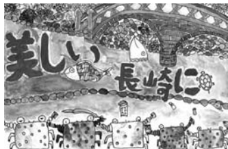
昨年度最優秀作品(小学生の部)

対市内の小中学生 対小学生の部 対小学生の部 のポイ捨ておよび歩きたばこをやめて、美しい長崎「中学生の部」地球の環境をみんなで守ろう、地球にやさしい人のまち長崎 ※いづれもサイズは四つ切り。各自で考え