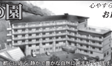
都心に近く、静かで豊かな自然に囲まれています。

心やすらぐ悠々自適な暮らしが始まりました。 お1人でも「安心」、「快適」の住まい。