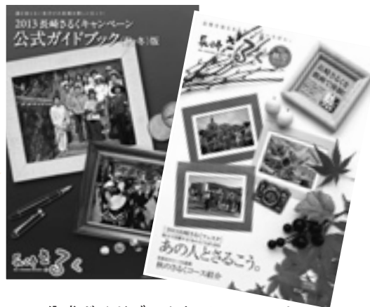
公式ガイドブックとパンフレット

アプリを使って上の画像をスマートフォンで撮影すると、紹介動画が始まります。※動画をご覧いただくには無料アプリ「動フォト」のダウンロードが必要です。