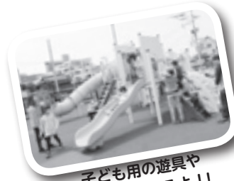
子ども用の遊具や健康遊具もあるよ!!