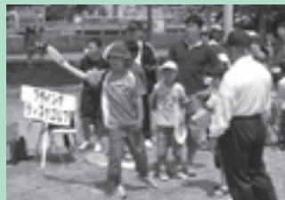
フライングディスクゴルフ