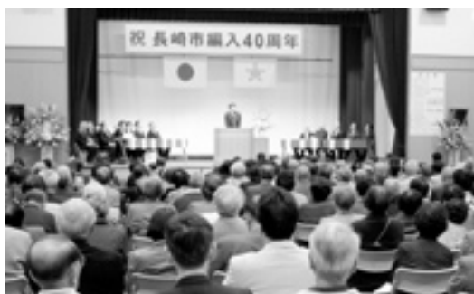
多くの方々が出席して編入40周年を祝いました

4月14日、「旧三重村・長崎市編入40周年記念大会」が三重地区市民センターで行われました。