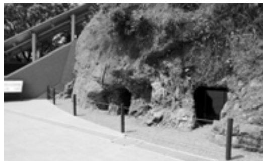
平和の大切さを学んでもらうために

3月26日、平和公園正面階段脇で見つかった防空壕の一般公開を開始。当時の写真や絵を使った解説板を設置し、市民や修学旅行生などの新たな平和学習の場として活用されています。