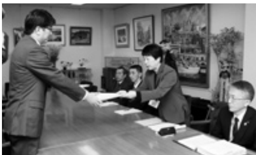
福祉部・建築部・消防局の職員が検討を重ね報告

3月28日、グループホームの火災を受け設置したグループホーム等の防災・安全対策検討プロジェクトチームが田上市長に報告書を提出。