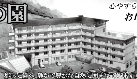
都心に近く、静かで豊かな自然に囲まれています。

心やすらぐ悠々自適な暮らしが始まりました。 お1人でも「安心」、「快適」の住まい。