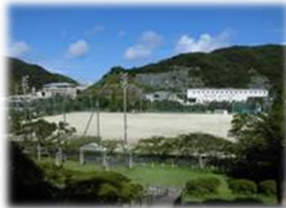
元宮公園 (地区公園)