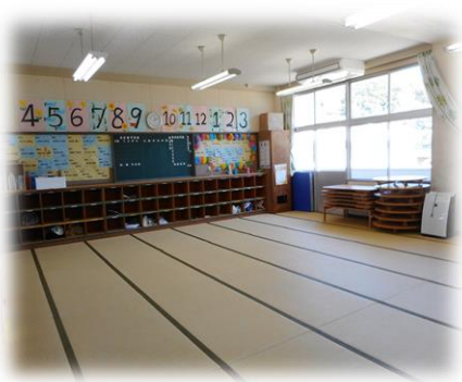
三和学童クラブガリバー (蚊焼小)