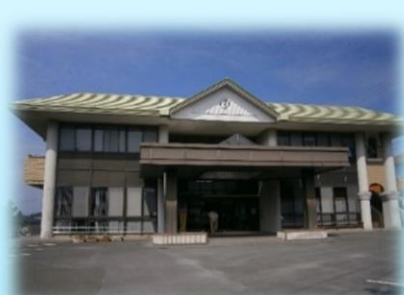
晴海台地区 ふれあいセンター