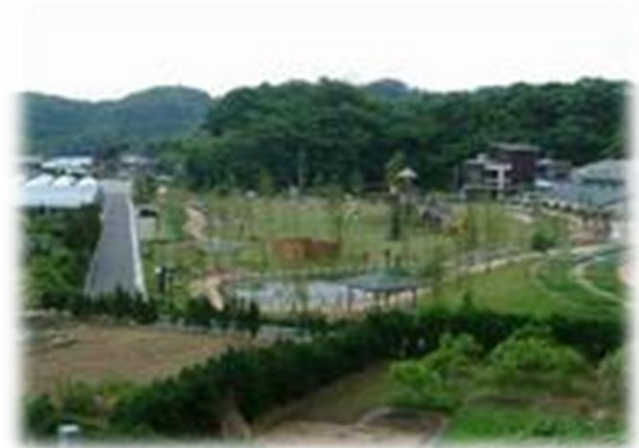
三和記念公園 (近隣公園)