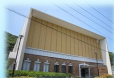
南部市民センター