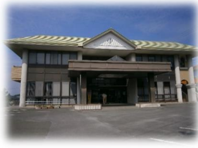
晴海台地区 ふれあいセンター