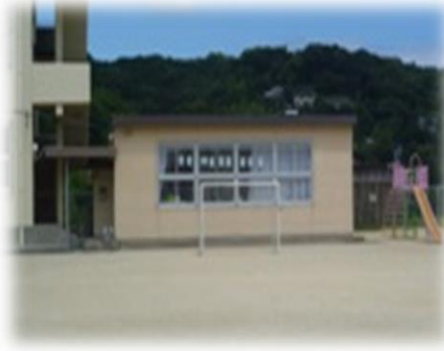
為石児童クラブ (為石小)