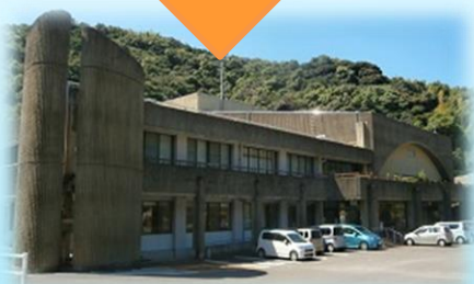
三和公民館 (蚊焼小学校区)