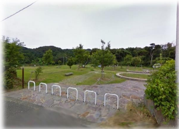
川原大池公園 (総合公園)