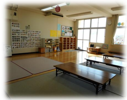
三和学童クラブ晴海台 (晴海台小)