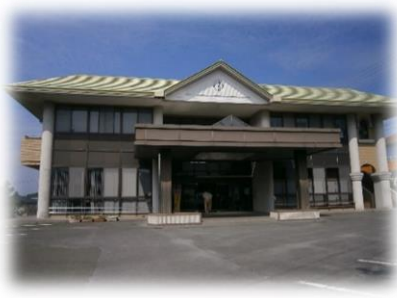
晴海台地区 ふれあいセンター