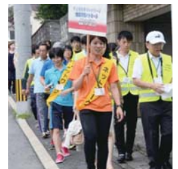
子どもを守るパトロール