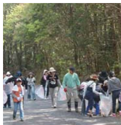
地域の環境美化活動

一人ひとりや単独の団体では できないことを、何人かで力 を合わせたり、団体同士で 一緒にすることで、できること が広がりますよ。