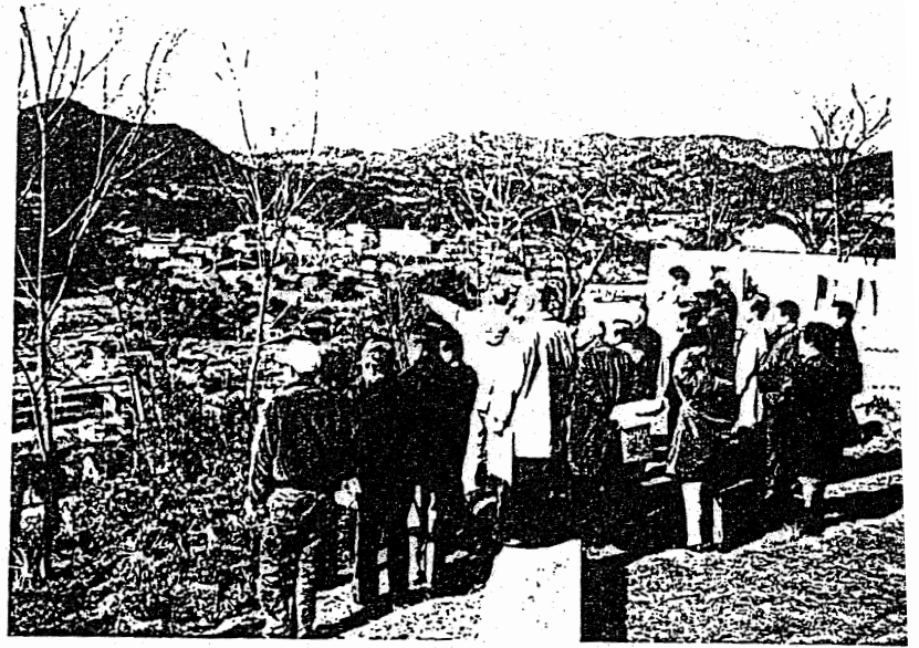
長与町周辺の整備状況についての説明（長与町）