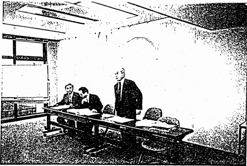
地元地権者の方による体験談（時津町）