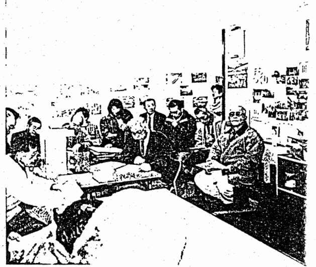
十善寺（館内町）地区のまちづくりについて勉強 （地元のまちづくり協議会の方からの説明）