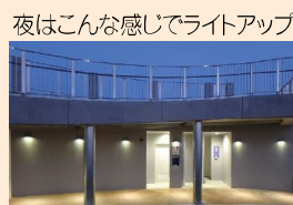
夜はこんな感じでライトアップ