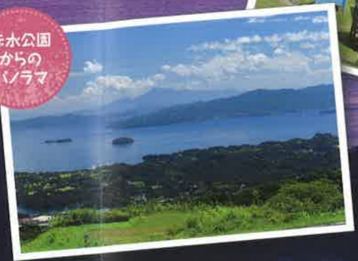
赤水公園からのパノラマ