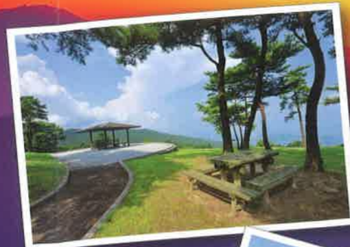
路傍展望所からの朝日

自然に囲まれ四季折々の姿を見せてくれる琴海赤水公園のオートキャンプ場やふれあい農園から一望できる大村湾の眺めは最高です。天気がいい日には、普賢岳や大村方面まで見渡すことができます。さらに宝物のような風景は夜明けの時間。島が明るく照らされ日が明けていく風景に気持ちもどンドン明るくなっていくよう。地元の人がおすすめの穴場スポットは、赤水公園から県民の森方面へ上がったところにある路傍展望所からの朝焼けの眺め。ちょっと早起きしてでも見たい絶景です。