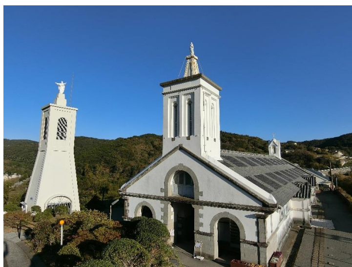
長崎市外海 出津教会堂（国指定重要文化財）