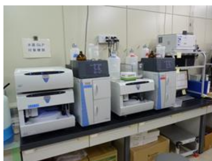
イオンクロマトグラフ装置 （無機化合物）