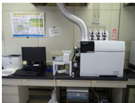
ICP質量分析装置 (金属類の分析)