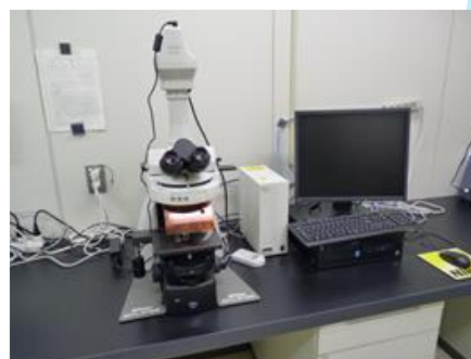
蛍光微分干渉顕微鏡 (藻類、病原性原虫等の検査)