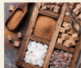
寛永元年(1624年)創業とされるカステラ の老舗・福砂屋は、ポルトガル人から製法 を学んだと言われています。

輸入砂糖や菓子と関わりが深い長崎街道「シュガーロード」を辿ると、長崎街道の歴史だけでなく、400年以上もの時をかけて発展し続ける砂糖や菓子の文化に触れることができる。