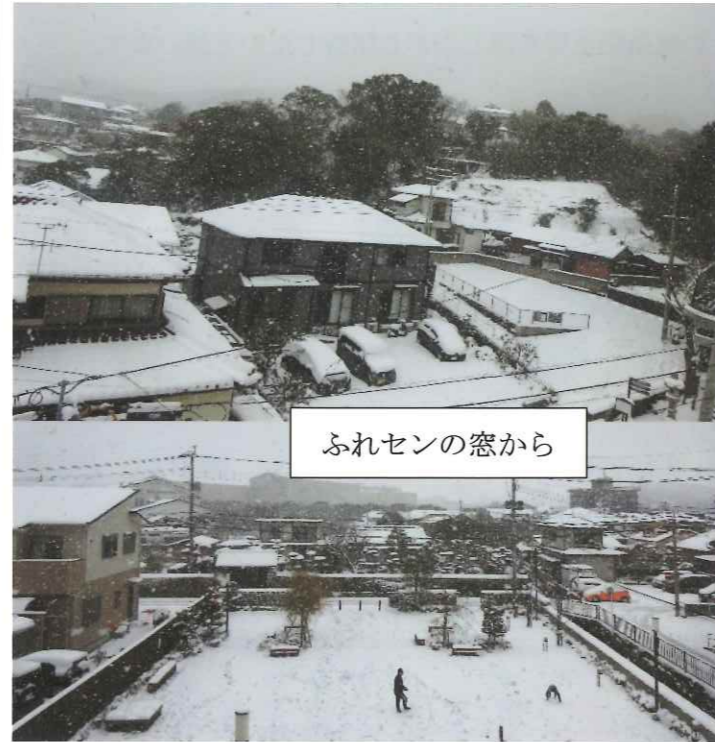
ふれセンの窓から

玄関先には大きな雪だるまがあちこちに置かれ、高齢者も久しく童心に帰った雪でした。