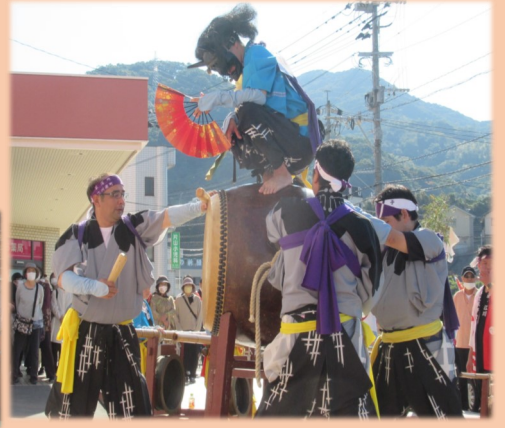
▲竿浦・江川・江川南の浮立