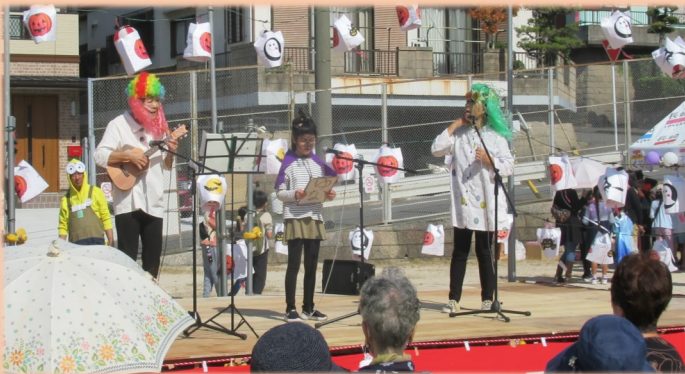
▲子どもも大人も楽しめるステージ発表でした♪

「土井首くんち」は11月3日(金・祝)土井首地区内の各地で開催されました。こちらも神事以外の演目は4年ぶりとなりました。三和町の大山祇神社では「舞姫」の奉納がなされ、毛井首公民館まで「お神輿」や「稚児行列」が練り歩きました。平山町の天満神社では「大名行列」や「子ども浮立」が披露されました。竿浦・江川・江川南の「浮立」は朝から夕方まで地区内の各地を回り披露され、多くの方々を魅了しました。