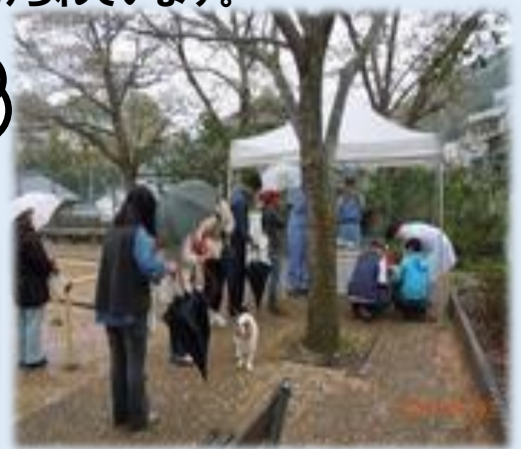
◀▲狂犬病予防集合注射の様子