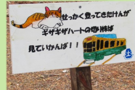
▲小学生たちの看板