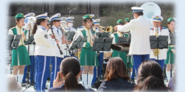
▲県警音楽隊の演奏♪