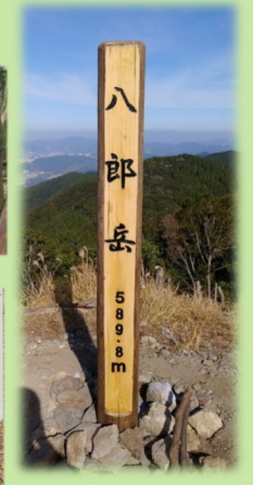
▲新たに設置した標柱