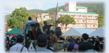
▲ペーロン船からの餅投げ

当日はRAINBOW MUSICとヒップホップダンスの子どもたちのコラボや県警音楽隊の演奏、ペーロン船からの餅投げ等、ステージ・ブースとも大盛況でした。