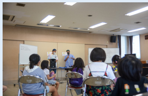
▲作業の様子、どんな歌詞になるのか！？