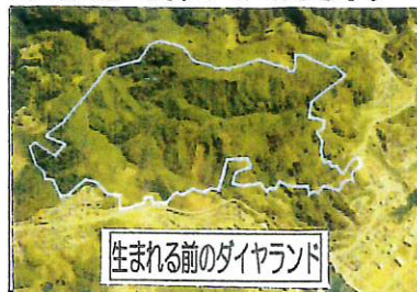
生まれる前のダイヤランド