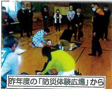
昨年度の「防災体験広場」から

本年も「コロナ禍」は、私たちの「まちづくり活動」にブレーキをかけるようです。協議会では、去る10月5日（火）、臨時に「拡大役員会」を開催して、今秋予定している各部会主管のイベントについて協議しましたが、「密」が心配されることから、すべての部会から「やむを得ない。中止すべき」との声があり、協議会として「今年度各部会主管のイベントは中止」とすることに決めました。残念ですがやむを得ないと思います。