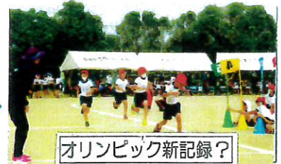
オリンピック新記録？

コロナのために延期になっていた小学校の運動会が、穏やかに晴れた10月24日（日）、同校グラウンドで盛大に行われました。コロナ禍のため観覧者は家族のみで、楽しみの「お弁当タイム」もなく子供たちにとっては、寂しいことだと思いますが、「コロナなんて吹っ飛ばせ」と