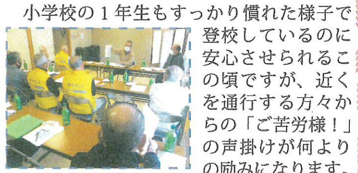
<高木事務局長資料説明>

小学校の1年生もすっかり慣れた様子で登校しているのに安心させられるこの頃ですが、近くを通行する方々からの「ご苦労様！」の声掛けが何よりの励みになります。