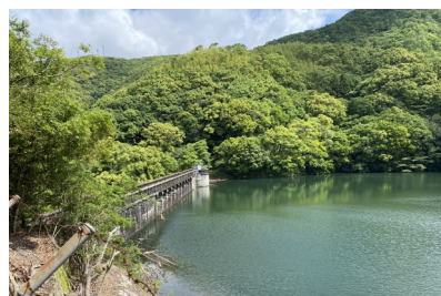
ダム本体と貯水池の眺め