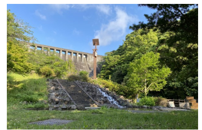
「小ヶ倉水園」として整備されています