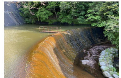
副ダムと呼ばれる小さなダムもあります