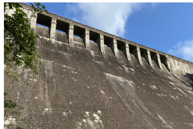
壁面を真下から見ると大迫力です