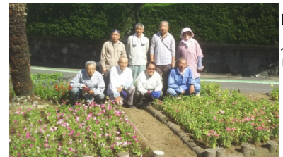
ロータリー 小ヶ倉町2丁目