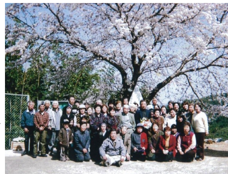
(大山町の皆さん 教会前広場で)

今月号で自治会リレーのコーナーは終了となります。自治会長の皆様、ご協力ありがとうございました！