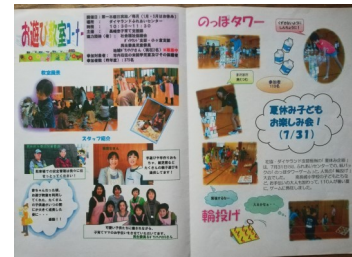
支部広報紙「いきいき社協」

その他、「高齢者ふれあいサロン」への助成や、老人クラブや老人クラブ交流会、倉老連演芸会への協力。ウォーキング大会や、防犯パレードへの応援、子ども会と連携しての年賀状を送る活動、「安心カード」の配布などの「目立たないけどキラリと光る活動」を続けています。