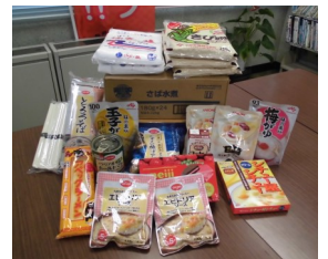
今年6月に実施したフードドライブの際に小ヶ倉地域センターにお持ちいただいた食品