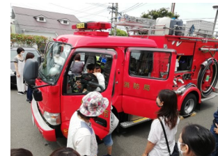
ダイヤランドにお遊び教室が来た(お遊び教室)